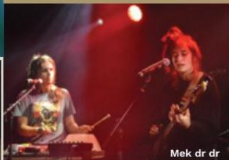
Mek dr dr

20/11 - ne memoroëbelen oëved mè neu Brusselse leekes: Brussels Tuub 4 leifteg in den AB!